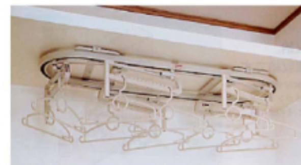
② ロータリークローゼット 巾168×奥行80cm