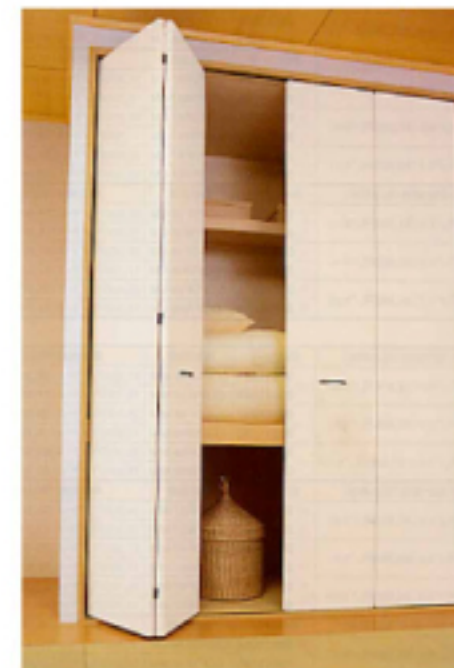
① クローゼット折れ戸 間口6尺・和風タイプ