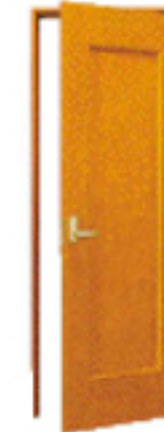
1 ドア 框タイプ