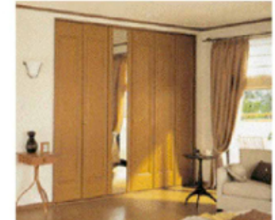
2 クローゼット折れ戸 施工例(1.5間) 框タイプ・間口1間